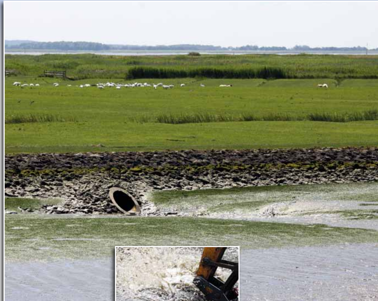
Speicherbecken im Vorland von Neufeld zur Spülung des Außentiefs.