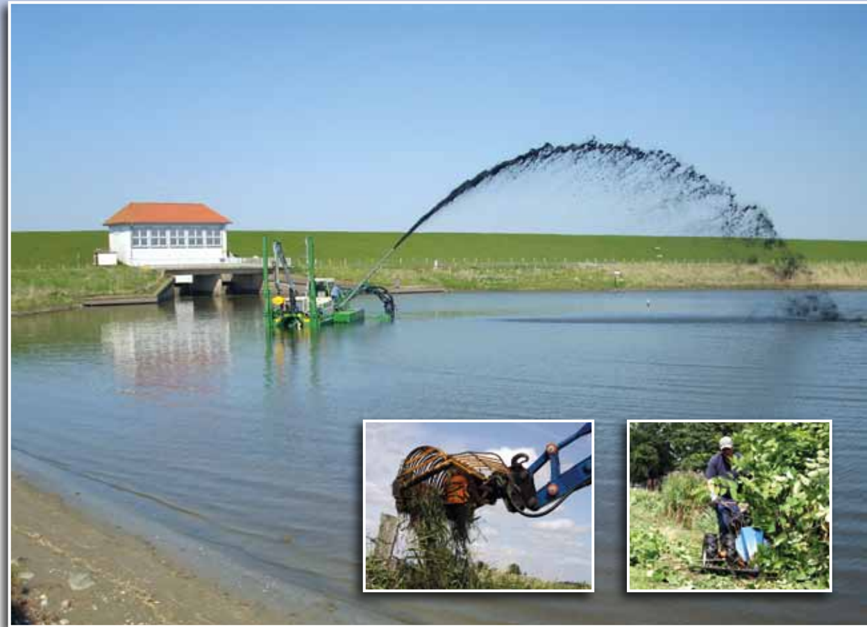
Ein Schwimmbagger – hier im Probebetrieb – befreit die Speicherbecken von Sediment und Schlamm (gr. Bild). Die Mäharbeiten an den Ufern der Gewässer werden mit kleinem und großem Gerät durchgeführt.

Darüber hinaus ist der DHSV durch den Abwasserverband Dithmarschen auch für die Abwasserbeseitigung aus häuslichen Kläranlagen, die Umsetzung der EU-Wasserrahmenrichtlinie und die Geschäftsführung seiner Mitgliedsverbände verantwortlich.