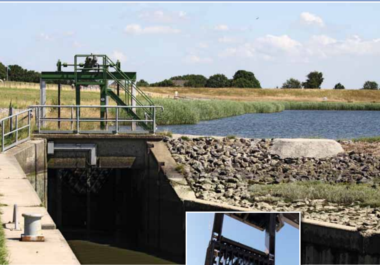
Spülschleuse im Neufelderkoog (gr. Bild). Das kleinere Bild zeigt einen Teil einer Rechenreinigungsanlage am Schöpfwerk St. Annen.