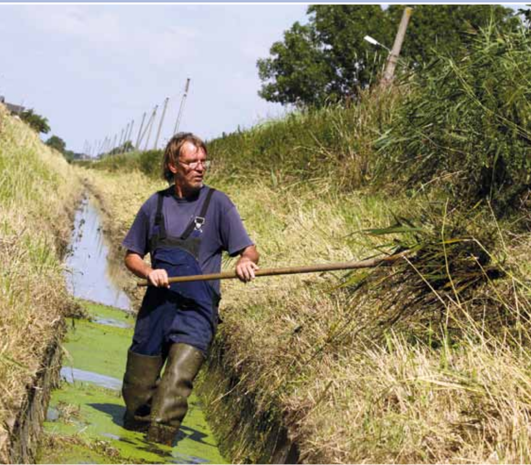
In einzelnen Abschnitten ist bei der Pflege der Gräben noch Handarbeit nötig.