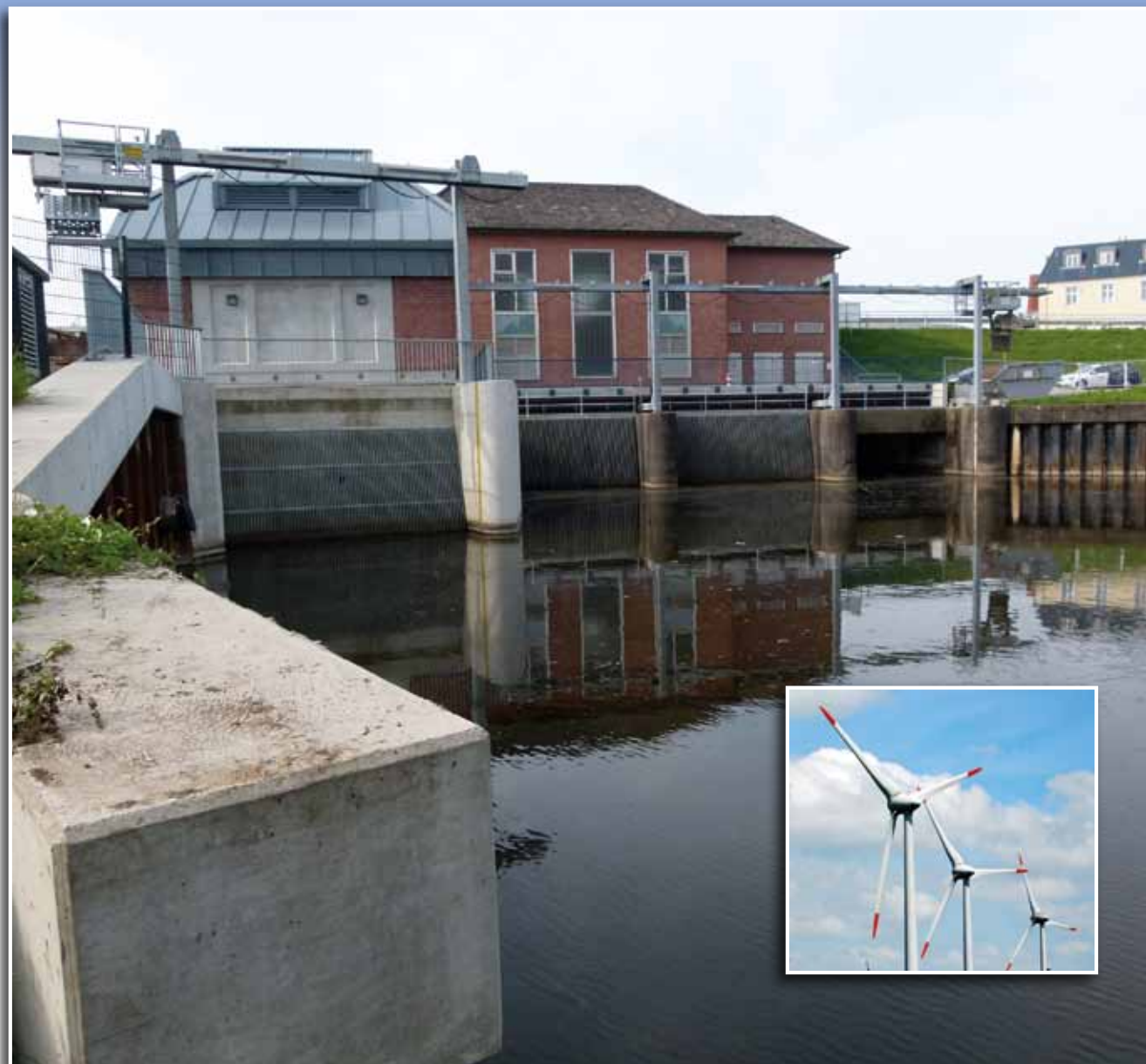
Die Erweiterung des Schöpfwerks Brunsbüttel-Nord wurde 2012 abgeschlossen. Pumpleistungen von 18 m 3 /sec sorgen für die Entwässerung des Hinterlandes.

Der Deich- und Hauptsielverband Dithmarschen hat die Rechtsform eines Wasser- und Bodenverbandes im Sinne des Wasserverbandgesetzes (WVG, 12.02.1991) und ist damit eine Körperschaft des öffentlichen Rechts.